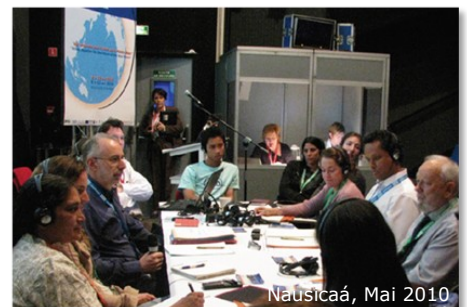
Nausicaá, Mai 2010