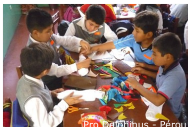
Pro Delphinus - Pérou

> Pour partager votre propre rapport d'activité, écrivez nous: info@worldoceannetwork.org