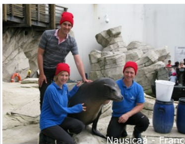
Nausicaá - France