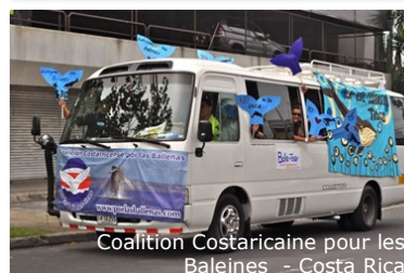
Coalition Costaricaine pour les Baleines - Costa Rica