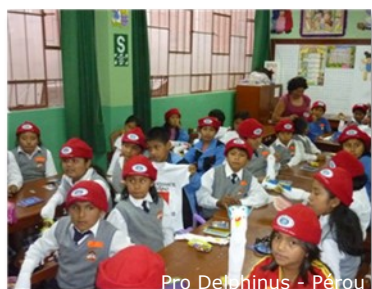
Pro Delphinus - Pérou

A l'appel du Réseau Océan Mondial, de nombreux membres et partenaires ont participé à l'initiative.