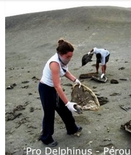
Pro Delphinus - Pérou