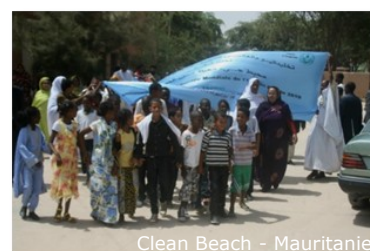
Clean Beach - Mauritanie