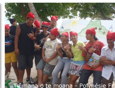
Tē mana o te moana - Polynésie Fr