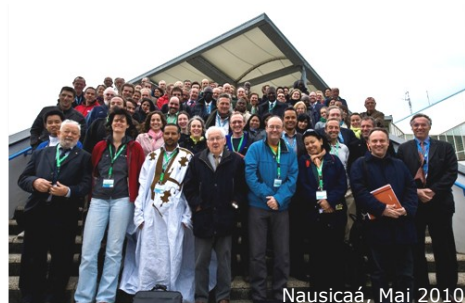
Nausicaá, Mai 2010